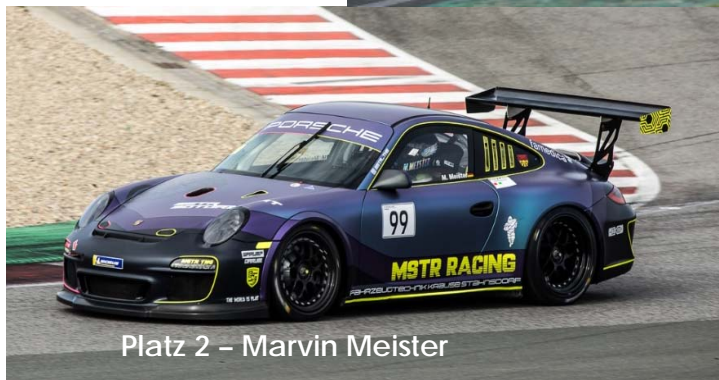
Platz 2 – Marvin Meister