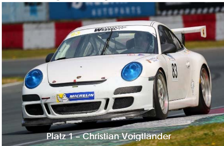
Platz 1 – Christian Voigtländer